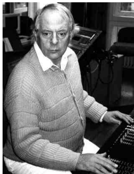
Карлхайнц Штокхаузен (Karlheinz Stockhausen, 1928), композитор

Первым композитором минималистом считают Терри Райли (Terry Riley, 1935). В 1964 г. он написал пьесу для симфонического оркестра «In C» (В До): оркестр играл всего одну ноту «до», но эта игра была особенной. Дело в том, что тембр такого звучания имел не просто обертоновый спектр какого-то одного инструмента, а состоял из целого оркестрового звукового комплекса, так построен-